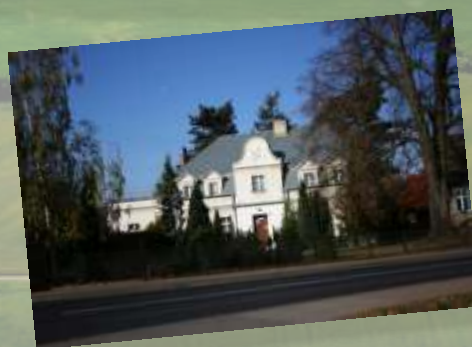
Urząd Gminy Duszniki, ul. Sportowa 1, 64-550 Duszniki